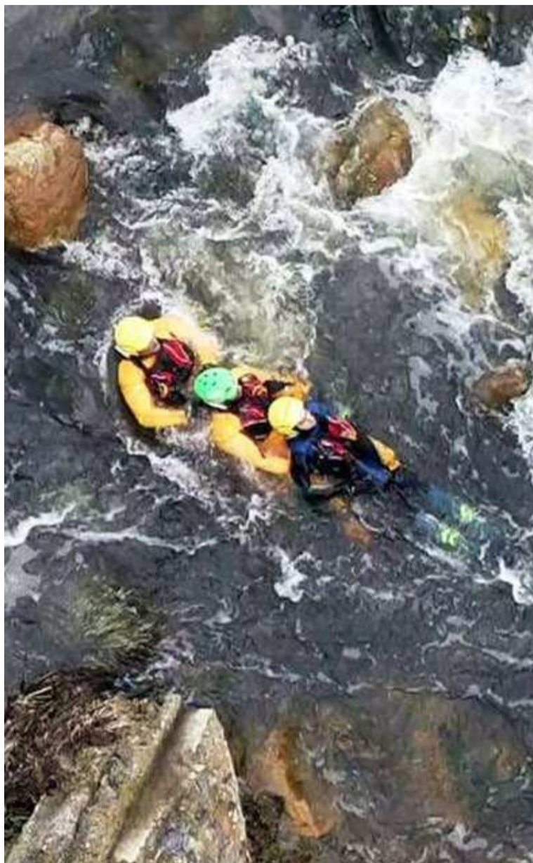
Una de las prácticas de navegación a contracorriente con una persona.