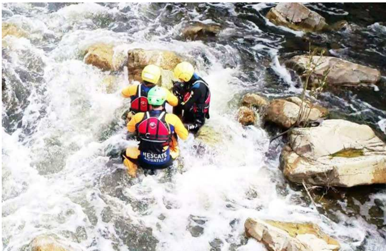
Los voluntarios del Geras practican en el uso de los materiales con los que cuentan para esta labor de rescate.